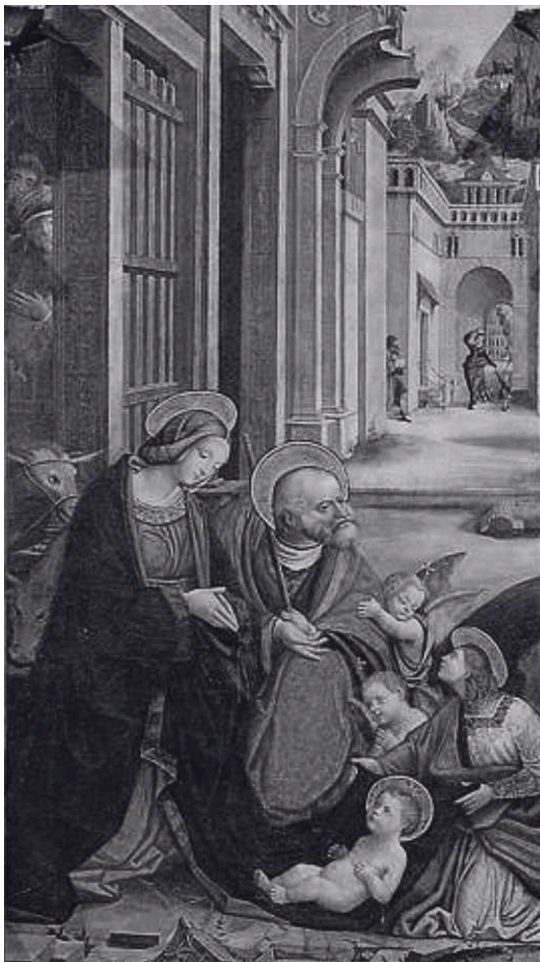
(Particolare del pannello centrale del Polittico di Deferente Ferrari, Precettoria di Sant'Antonino di Ranverso, 1530 ca., ex voto donato dalla Città di Moncalieri)