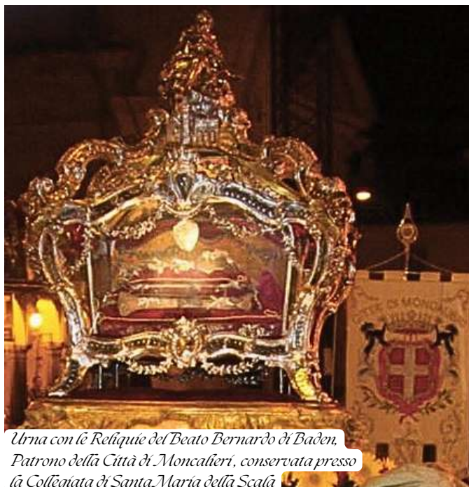
Urna con le Reliquie del Beato Bernardo di Baden, Patrono della Città di Moncalieri, conservata presso la Collegiata di Santa Maria della Scala